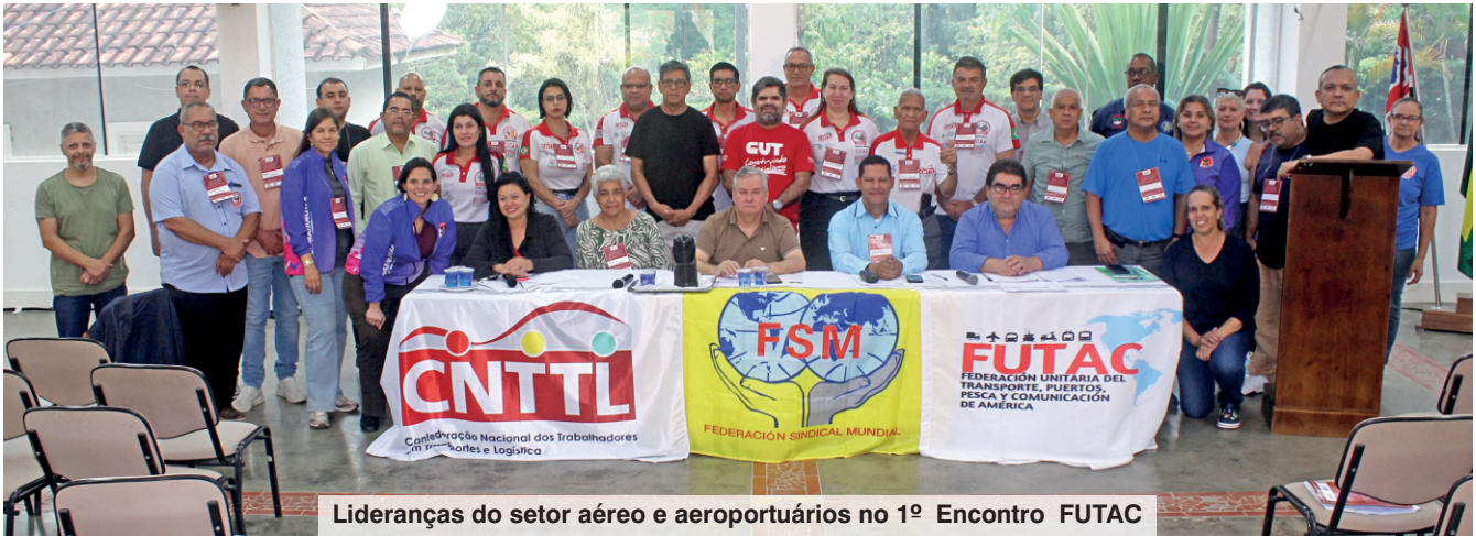
Lideranças do setor aéreo e aeroportuários no 1º Encontro FUTAC

Evento elabora a carta de Sorocaba/Brasil com declaração de unidade e solidariedade à Venezuela, Cuba, Colômbia e toda a América latina. Documento também manifesta repúdio aos Estados Unidos pelos ataques contra embarcações de pescadores da Venezuela e Colômbia, e pelo bloqueio econômico a Cuba. Encontro avaliou como negativas as privatizações e concessões à iniciativa privada de vários